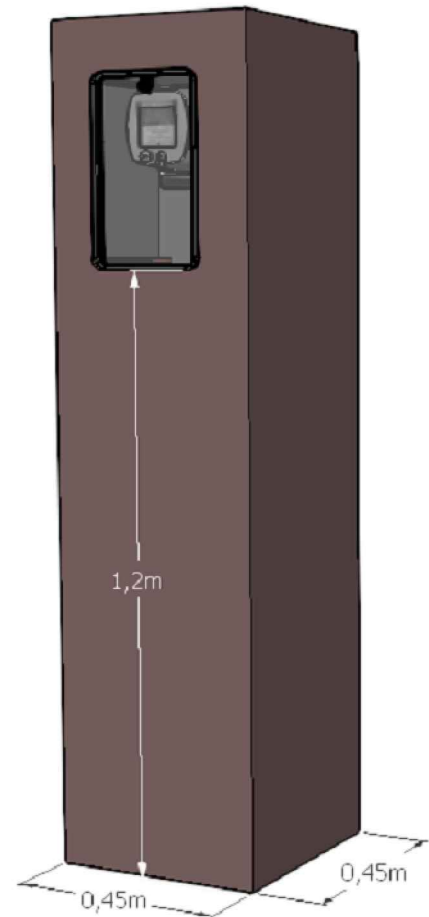
Dimensiones del pilar simple

NOTA 3: Las distancias a instalaciones de agua estan estipuladas en el punto 6.1 de la ETc 7-01-17